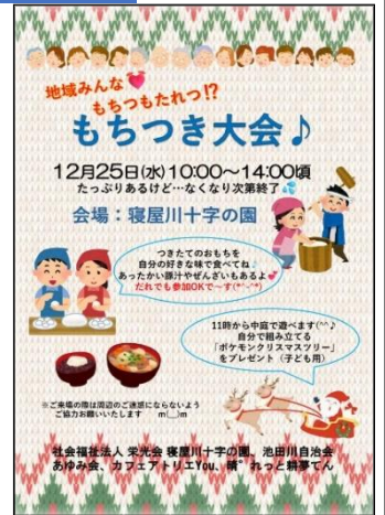
事前告知のポスター

⇒あんこがあると、おはぎのようなイメージで好きな人も多いのではないかと思います。